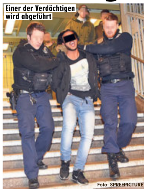
Einer der Verdächtigen wird abgeführt

Am Samstag, gegen 21.30 Uhr, attackierten drei Ägypter (18, 19, 21) in einer U-Bahn einen Mann aus Guinea (20). Offenbar ging es um einen Streit im Dealer-Milieu. Zeugen alarmierten die Polizei. Die Beamten nahmen die drei Schläger am U-Bahnhof Görlitzer Bahnhof fest.